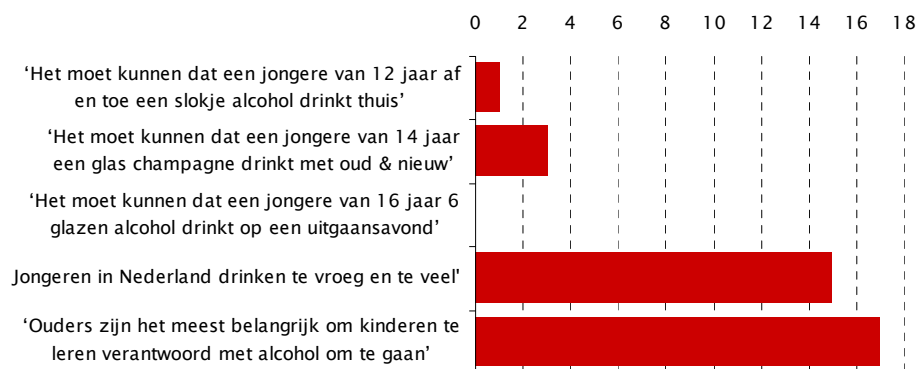
Grafiek 1: Aantal ouders eens met de stelling

Volgens een groot deel van de deelnemers wordt inderdaad te veel en te vroeg gedronken door jongeren in Nederland (zie grafiek). Een aantal deelnemers is het niet eens met deze opvatting: 'Ik zie om mij heen helemaal niet dat jongeren zich inzuipen, en lazarus worden' . Volgens enkelen moet de rol van de media niet onderschat worden: 'Volgens mij wordt er minder gedronken dan wat er in de media wordt gezegd' . Een deel van de ouders noemt grote verschillen tussen de jongeren nu en jongeren vroeger. De maatschappij is veranderd. Jongeren van nu worden blootgesteld aan meer verleidingen, alcohol is makkelijk verkrijgbaar en het drinkgedrag is anders dan vroeger: 'Het is zo mateloos. Het is zo ontzettend veel' .